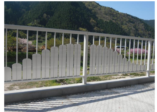
アルミ製デザイン防護柵

道路幅員が狭く十分な歩行者スペースが確保できないとき、隣接した 河川、水路、換地などの上空を有効利用することで、人にやさしい安全な歩道整備のご提案をいたします。