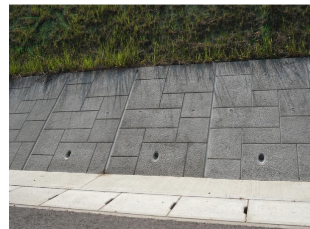
商品名（グラスカル）