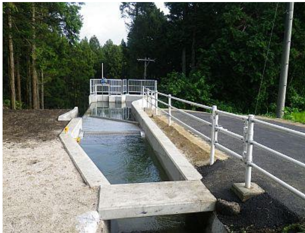
商品名(無動力除塵機)