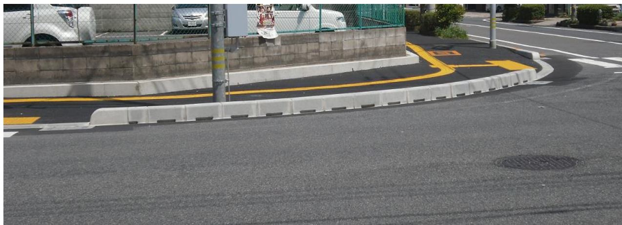
商品名（ライン導水ブロック）