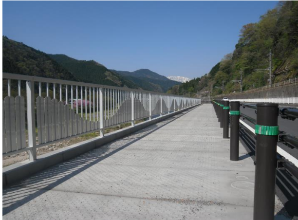
商品名（セーフティロード）