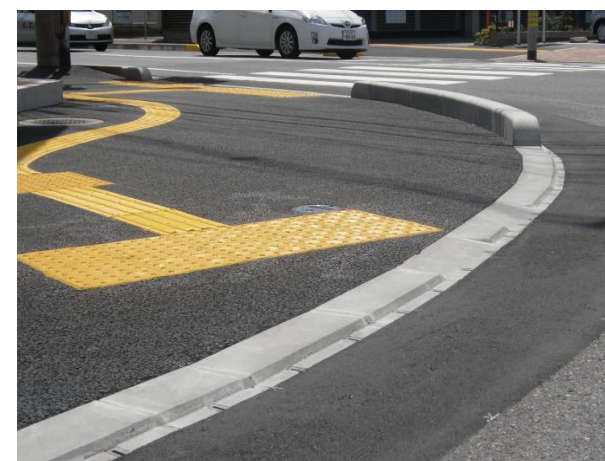
ユニバーサルブロック

ライン導水ブロックは縁石と水路を一体とした商品で、縁石の全延長に集水口をそなえて内蔵管路で排水しますので、路面より速やかに雨水を排除でき、水溜りの解消、水はね防止することができます。また、交差点や横断歩道部分では 集水口付ユニバーサルブロックをそなえており、歩行者全体に安心、安全をご提案いたします。